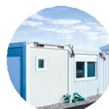
Modules préfabriqués & locaux techniques