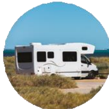
Camping-cars & véhicules utilitaires