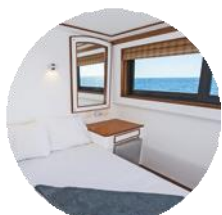
Cabines de bateau